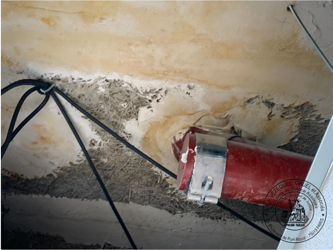
Zone « Profilés » (côté boulevard de La Villette)